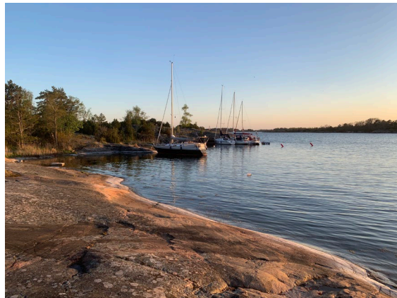
Klubbholmen sommaren 2023.

Styrelsen rekommenderar naturligtvis ett besök på klubbholmen.