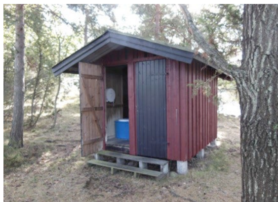
Miljöstationen, i form av toalett och sop-Maja på Risö.

Informationsbladet som gavs ut senast är daterad till 2015-12-20 och handlade om att det fanns 50 miljöstationer i Östergötlands skärgård utspridda från Bråviken i norr, Arkösund - S:t Anna skärgård - Tjust skärgård som ligger i söder. I Vättern finns dessa i Norra delen vilket är Askersunds skärgård där det finns 4 miljöstationer. Detta har bidragit till att nedsmutsningen på öarna och utsläppen av toalettavfall reducerats sedan de byggdes på -70 talet.