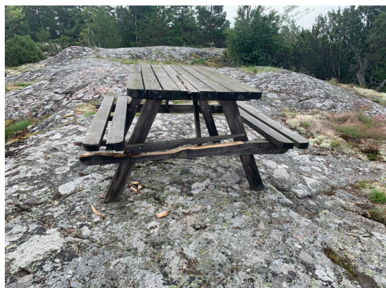
Bänk och bord som behöver repareras. Brädan som håller bänken har spruckit.

Under 2024 finns det behov om underhåll. Bland annat ska man laga bänkar och bord samt olja bryggan och ev fasaden på toaletten.