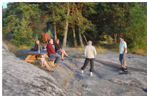
Det är alltid trevligt att få sitta vid ett bord. Vi fick även beröm från besökare att ön var trevlig och att toaletten var välstädad och fin, faktiskt den bästa i skärgården.

Lindskär är en mycket populär ö hos våra medlemmar, under de dagar som det varit fin väder och att vindarna varit gynnsams så är det många besökt vår fina holme. Några besökare har också besökt holmen för första gången vilket vi tycker är trevligt, genom detta sätt kan vi värva flera medlemmar.