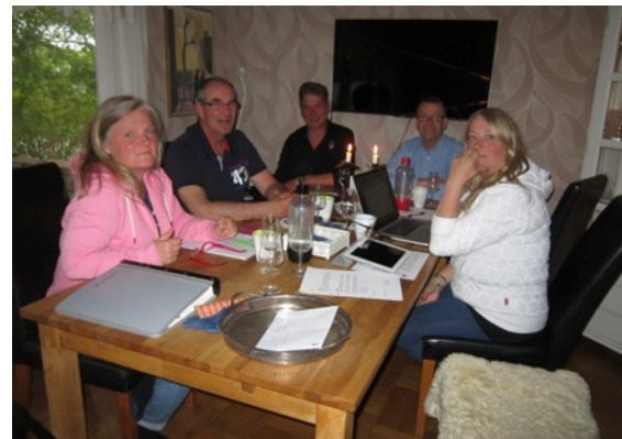
Styrelsen sitter samlad i Kimstad och diskuterar aktiviteter för 2015.

En viktig punkt i dagordningen är klubbholmen Lindskär.