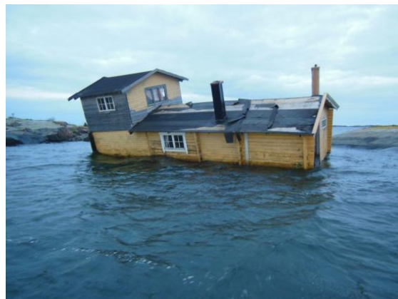
Husbåtsvraket hösten 2014, innan förlisningen.

Eftersom de som äger husbåten inte tillhör den samhällsklass som man skulle önska har dessa besvärat skärgårdsbefolkningen i området. Man har även befarat att husbåten skulle sjunka och utgöra en risk för de som passerar i farleden