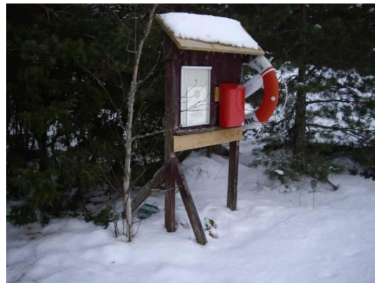
Anslagstavlan på klubbholmen.

När man är ute på isen så kan man förstå hur utsatt man är om olyckan är framme. Trots att vi möte två andra svävare så var man mycket ensam. Att trampa igenom isen innebär att man svävar i livsfara. En tanke går till de som bor ute på de Östgöta skärgårdsöarna och som vinter tid måste vara ute på isarna för att nå sina bostäder. Det känns tryggt att vi har en svävare i vår närhet som ständigt är beredd på att rycka ut och.