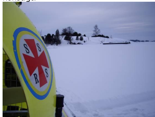
Sommartid är vi vana att det ligger en hel del båtar på bryggan.

Under patrulleringen hann vi även med att göra en liten avstickare till vår klubbholme Lindskär. Att få se Lindskär i vinterskrud var naturligtvis en upplevelse. Att se all snö och is där vi normalt brukar sitta och titta ut över viken kändes mycket konstigt.