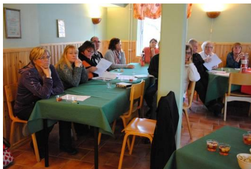
Årsmötesförhandlingarna i full gång!