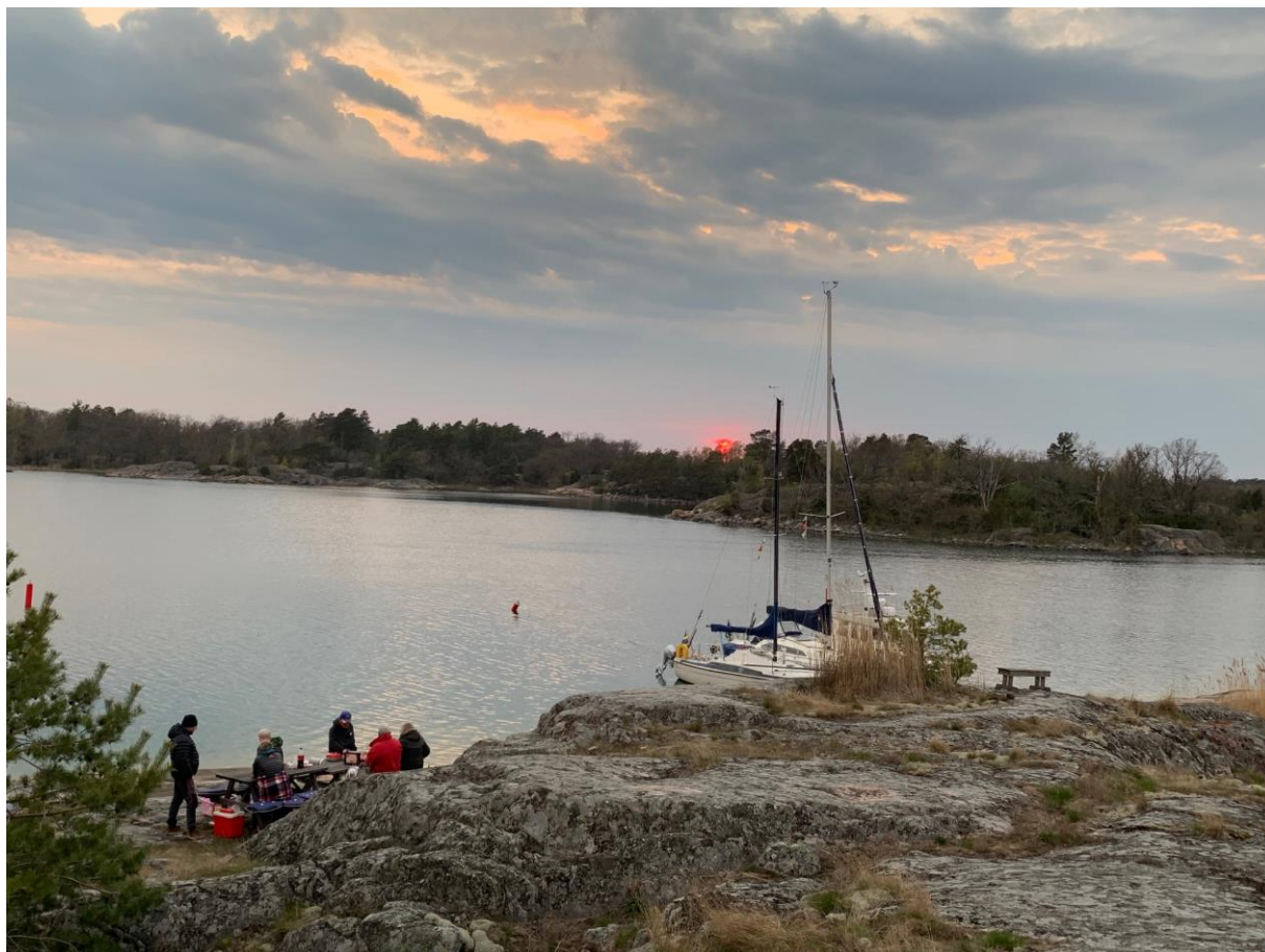
Lindskär den 13 maj 2021