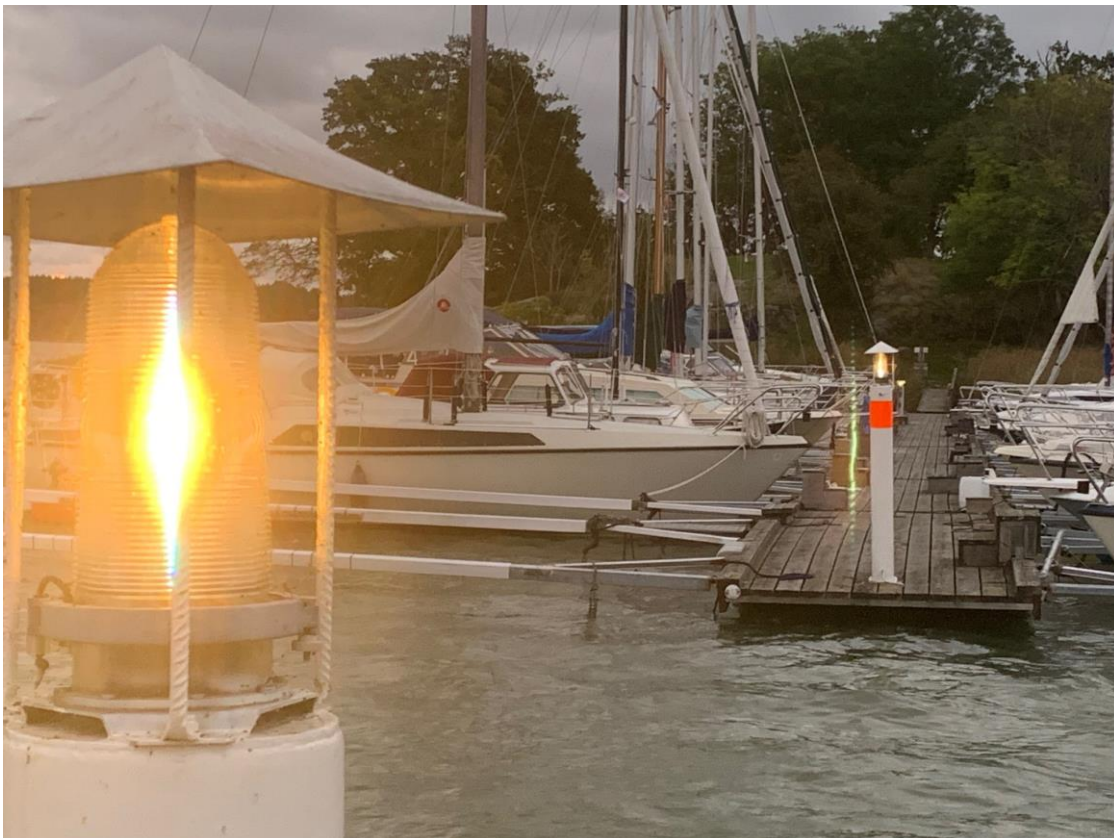
Fyrarna i Stegeborg, fyrljuset närmast i bild har ett fast ljus, medan den andra fyren blinkar med fyrkaraktären OC (3) 20 sekunder.