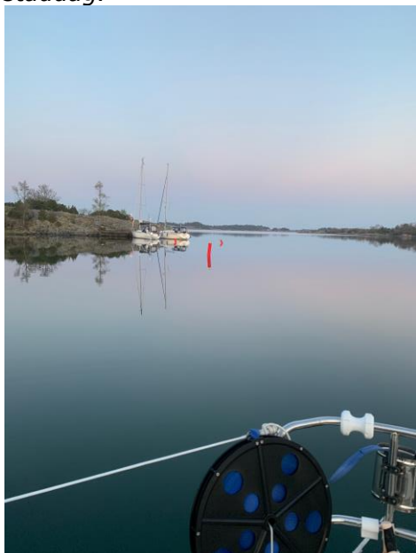
Tidig morgon Kristi Himmelfärdsdagen