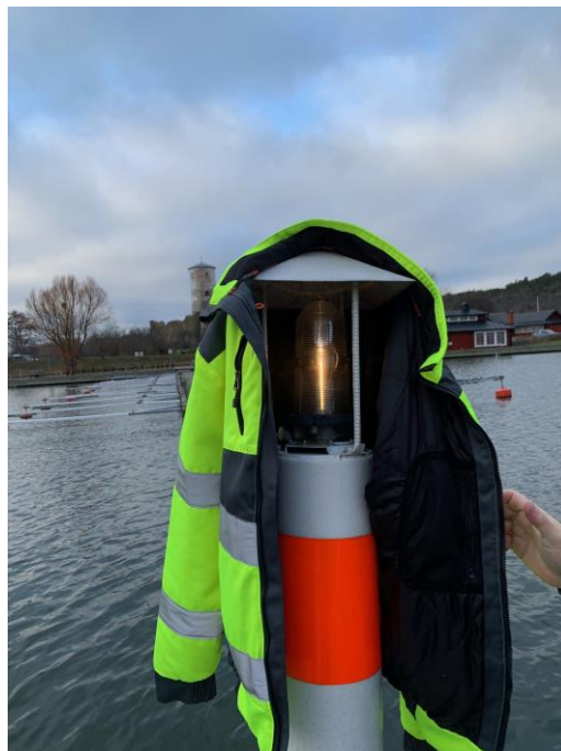
Bilden är tagen den 2 januari 2022 i samband med besiktningen som ska genomföras innan båtsäsongens start 2022.