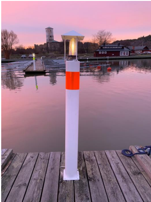
Bilden är tagen den 27 februari 2021 i samband med besiktningen som ska genomföras innan båtsäsongens start.

Sedan 2004 ansvarar Stegeborgs båtklubb för underhållet båda fyrarna som finns i småbåtshamnen i Stegeborg. En av fyrarna "blinkar" och har fyrkaraktären OC (3) 20 sekunder. Fyren är tänd under perioden 1 april – 31 oktober och finns med i sjökortet. Fyren på motsatta sidan har fast ljus och finns inte med i sjökortet som en fyr eller fast sjömärke. Årligen underhåller Stegeborgs båtklubb fyrarna samt genomför en besiktning av fyrarna. Vid de senaste besiktningarna hade man uppmärksammat att fyrarna var i behov av uppfräschning. De behövdes målas, samt att reflexer och fyrlinserna börjat mattas av. Under 2020 har Stegeborgs båtklubb målat om fyrarna, bytt reflexer och fyrlinser.