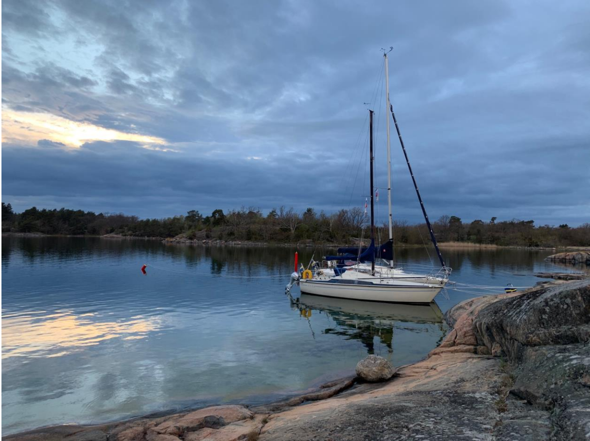
Så här såg det ut den 13 maj (Kristi Himmelfärdsdagen) när Stegeborgarna hade sin städdag.

Kristi Himmelfärdshelgen den 13 maj – 15 maj samlades några Stegeborgare för att göra den första städningen av ön. Toalettstädning ingick i dagens arbete, man fyllde på destillerat vatten i batteriet som laddas av solcellen så vi kan få belysning toan. Vidare städes allmänt på ön.